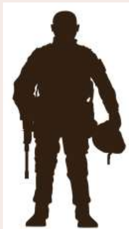
Командир військової частини