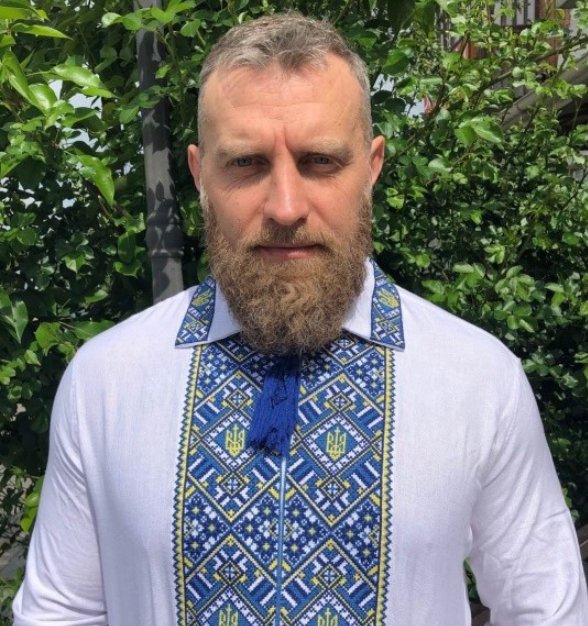
ГНІУШЕВИЧ Микола Григорович